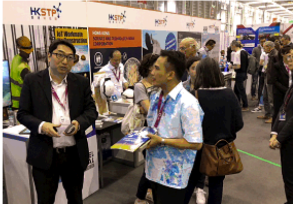
Captions: 香港有 98 个发明项目在第 46 届日内瓦国际发明展参展。