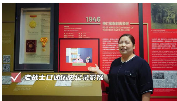
✓ 老战士口述历史记录影像