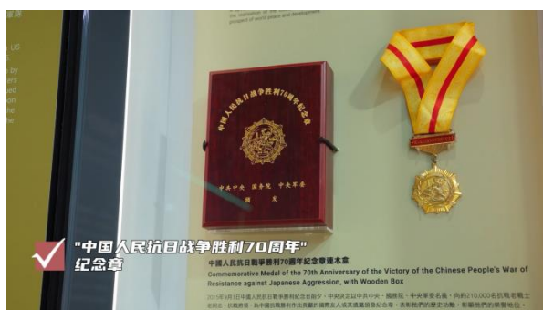
✓ "中国人民抗日战争胜利70周年" 纪念章